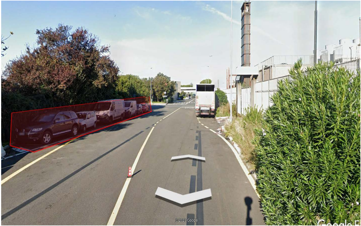
Fig. 3: Vista di dettaglio di Via Lunardi con indicazione degli stalli da liberare